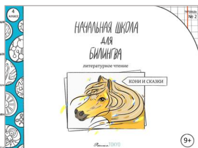
Литературное чтение. 4 класс, часть 2

Подробнее о нашей онлайн-школе для билингвов читайте здесь